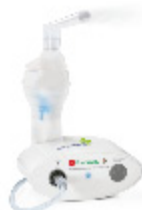
FARMACITY USB AEREOSOL