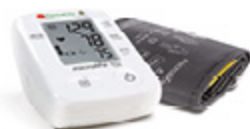
FARMACITY MISURATORE PRESSIONE