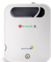
FARMACITY AEREOSOL CUBE