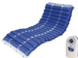
LEVITAS KIT A/DEC PIUMA UP ELEM