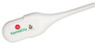
FARMACITY TERMOMETRO DIGITALE BIG SCREEN