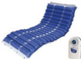
LEVITAS KIT A/DEC PIUMA UP ELEM